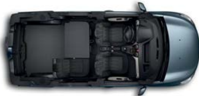
Banqueta trasera 1/3-2/3

* 2ª puerta lateral deslizante en opción según las versiones.