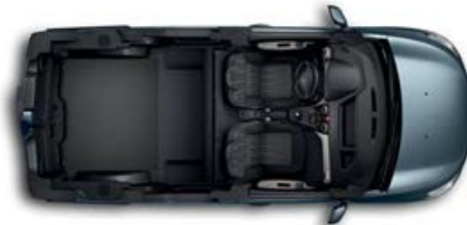
Banqueta trasera totalmente abatible